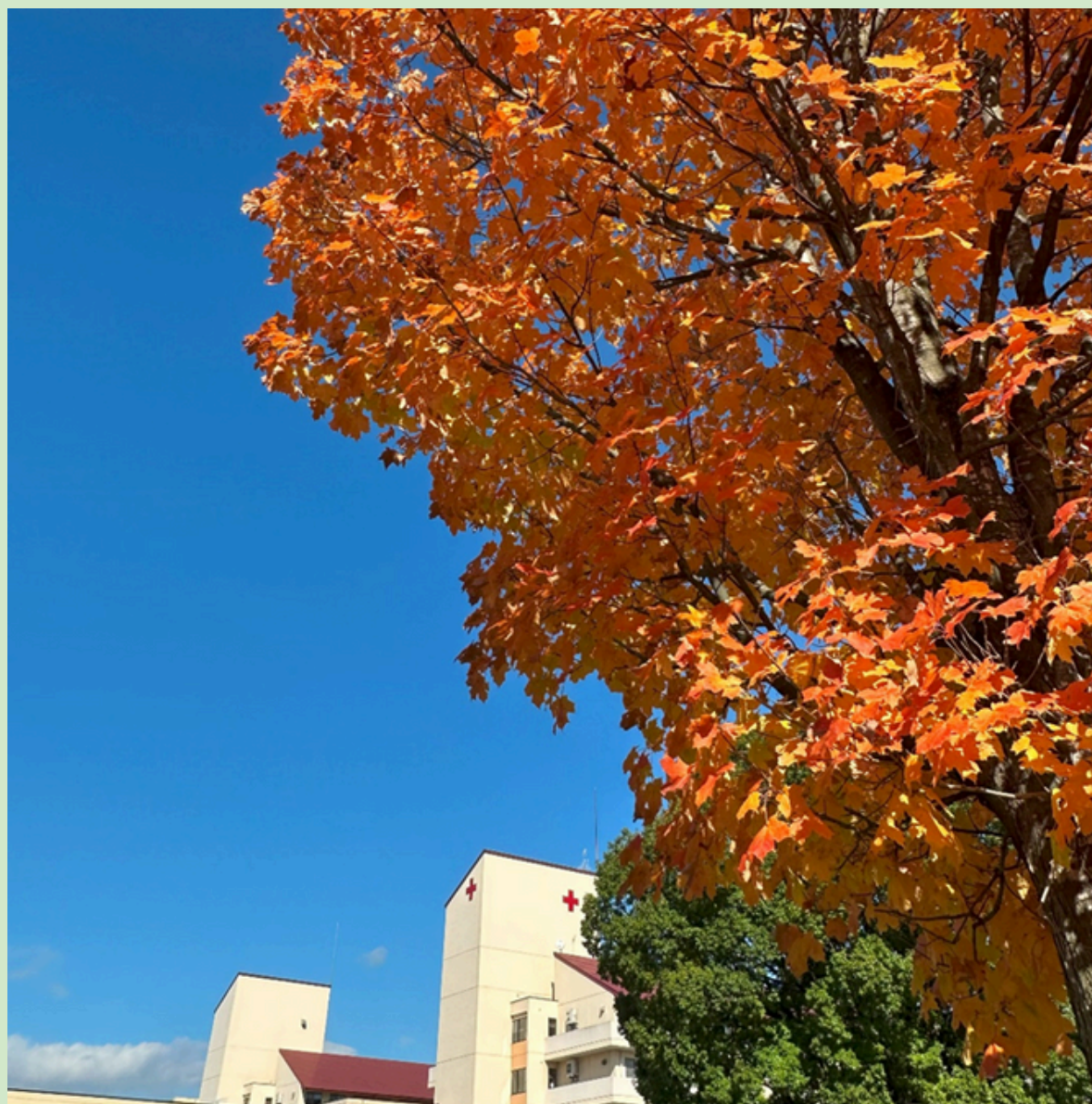
写真：正面玄関カエデ

私たちは、人道・博愛の赤十字精神にもとづき、 みなさまの生命と健康を守るために、信頼される医療を実践します。