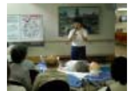
「まず、意識を確認します。」

の「でめま演てでし手小ル講たせ 家族なら手こ然た参工るその科神開会急、月 のと4県っの。加呼職のしの經催を手患9 命を救えるのはあなたな 脳分ではい停れとが、た師科ま日の様の ダ内平て止た心、赤をが、し間講や「 メに均、の方臟訓十わけ外たに演ご救急 ギ肺分急分もマ練字かが科。わと家族の日 が蘇すの3に！形法す気環待蘇対ー 法。到は練ジを指導説応科ホー を心着自習を使導説応科ホー 始停ま宅し実っ員明急、