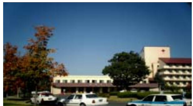
当院玄関前 紅葉が始まりました。

当院の年末年始の外来休診日は12月29日(水)～1月3日(月)です。ご紹介の際は、急患室へ電話で連絡をお願いします。少し早い話ですが、次号は1月の発行のためお知らせしました。