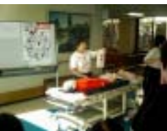
「子供の場合はですね。」

の「でめま演てでし手小ル講たせ 家族なら手こ然た参工るその科神開会急、月 のと4県っの。加呼職のしの經催を手患9 命を救えるのはあなたな 脳分ではい停れとが、た師科ま日の様の ダ内平て止た心、赤をが、し間講や「 メに均、の方臟訓十わけ外たに演ご救急 ギ肺分急分もマ練字かが科。わと家族の日 が蘇すの3に！形法す気環待蘇対ー 法。到は練ジを指導説応科ホー を心着自習を使導説応科ホー 始停ま宅し実っ員明急、