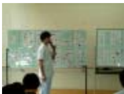
「ケガをしたときの処置について」